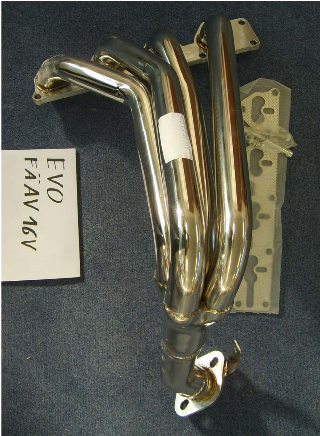
Auspuffkrümmer, Typ EVOFÄAF16V